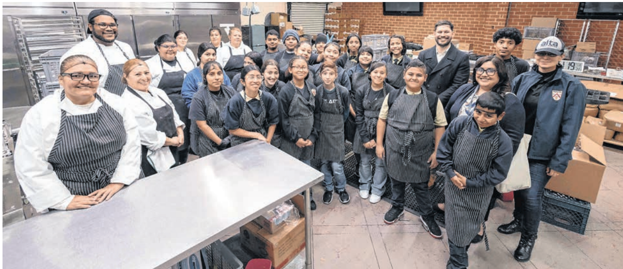
Prepa Tec LA, una escuela donde los alumnos son valorados por sus destrezas y talentos.