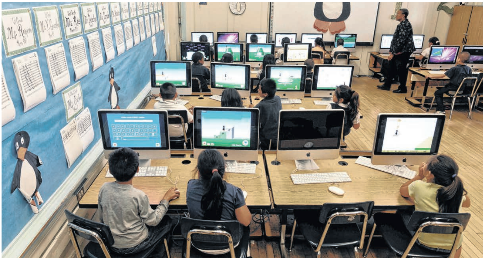
Uno de los objetivos de la escuela Today's Fresh Start es enseñar cómo enfrentar retos académicos, personales y emocionales.