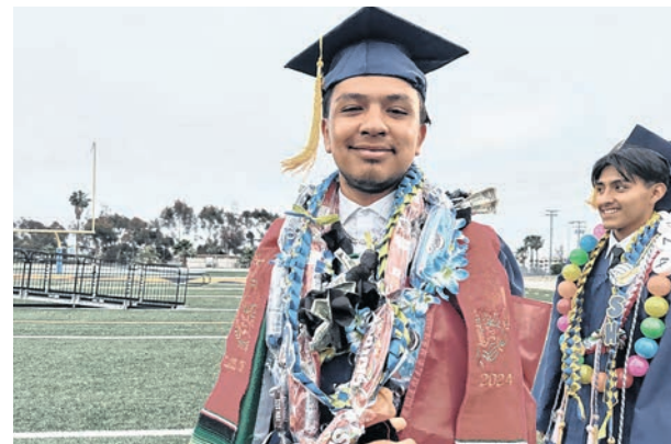
Los latinos son el grupo con más presencia en las aulas en el sur de California.