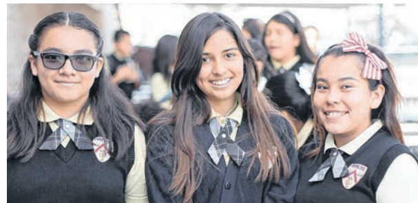
Actualmente la escuela Prepa Tec LA cuenta con un total de 345 alumnos en Los Ángeles.

Es un programa escolar que tiene como objetivo desarrollar estudiantes activos y jóvenes con mentalidad internacional que puedan empatizar con los demás y llevar una vida con propósito y significado