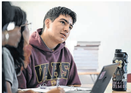
Los estudiantes recorren la ciudad, el estado y el país para aprender a través de su propia experiencia.