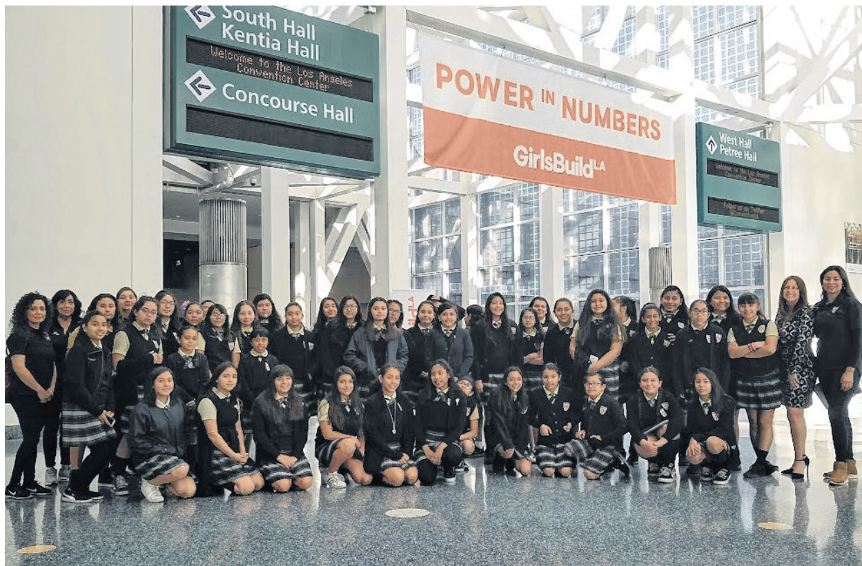
Las escuelas chárter atienden a más estudiantes debido en parte a sus esquemas más flexibles.