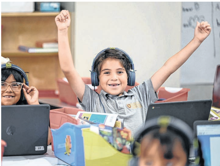
Bright Star atiende a estudiantes desde kínder hasta el grado 12.

Como la mayoría de los estudiantes en Bright Star son de primera generación, Bright Star