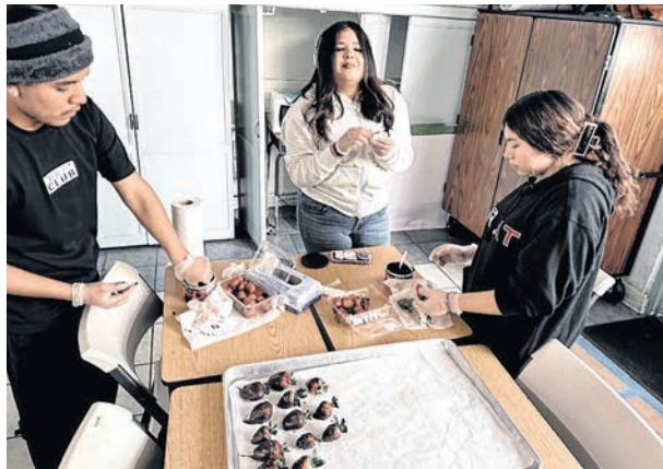
Las escuelas públicas chárter de California han adoptado desde hace años modelos de aprendizaje alternativos.

“Es un joven que básicamente se ha atrasado en sus créditos para quien la posibilidad de graduarse disminuye. Pueden ser jóvenes que experimentan problemas de vivienda. Tenemos más de 100 estudiantes sin hogar cada año. También llamamos vulnerables a las jovencitas que salen