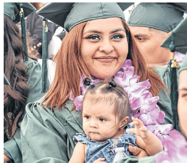
Los estudiantes encuentran recursos, herramientas y apoyo para cumplir sus metas académicas y sus sueños.

Un reciente informe concluyó que parte del éxito de las escuelas chárter se origina en cinco prácticas fundamentales que han logrado buenos resultados a lo largo de los años: un propósito claro centrado en el acceso a la universidad y la carrera profesional; la integración de la preparación en los horarios escolares y los planes de estudio; la sensibilización sobre las opciones, la eliminación de las barreras de acceso y el seguimiento continuo de los datos para una mejoría continua. Estas prácticas constituyen un modelo para otras escuelas que deseen establecer modelos exitosos que se reflejan en las caras que presentamos en este homenaje.