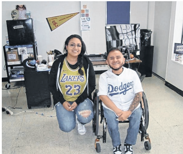
Los alumnos pasan el 80% del tiempo fuera del salón de clase.