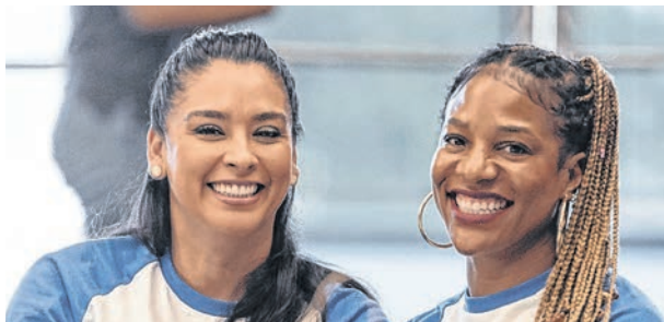
Las autoridades de la escuela fomentan el apoyo entre los mismos estudiantes, los padres y los maestros.

Prepa Tec LA basa su misión en el conocimiento intercultural, el aprendizaje holístico y la comunicación