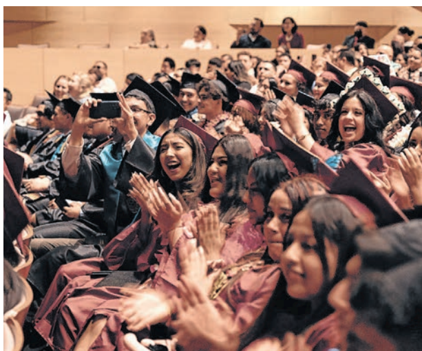
Un gran porcentaje de estudiantes graduados asisten a universidades de cuatro años.