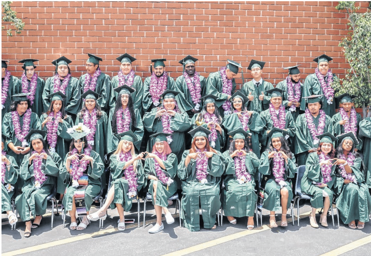
La escuela Matrix tiene dos sucursales en el sur-centro de LA y en el área Wilshire-Hope.

Ejemplos de los modelos de instrucción no presencial son los: estudios independientes, aprendizaje basado en proyectos, aprendizaje remoto o a distancia, aprendizaje en línea, estudio en el