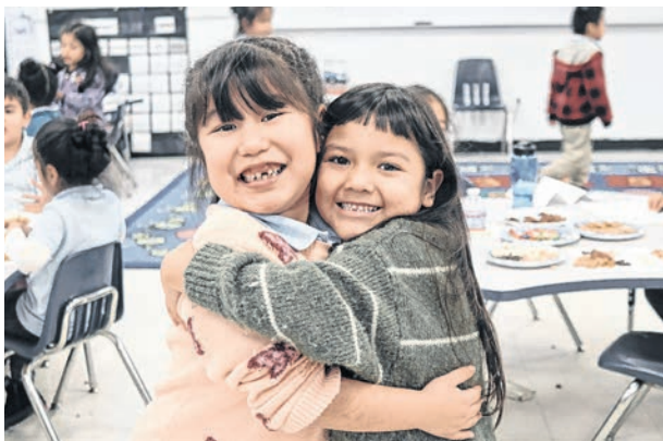
Las chárter se enfocan en lograr que sus alumnos desde edades tempranas trabajen en comunidad.