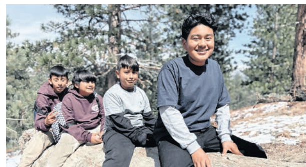
No todo el aprendizaje se realiza al interior de las aulas; los estudiantes aprenden a través de experiencias.