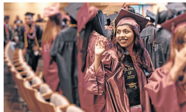
Las tasas de graduación de las escuelas chárter son superiores a las de las instituciones tradicionales.