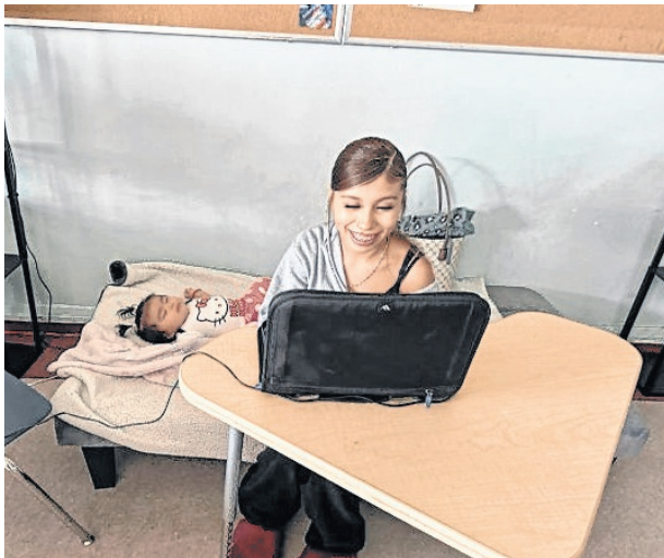
La escuela ofrece flexibilidad para madres adolescentes que quieren terminar sus estudios.