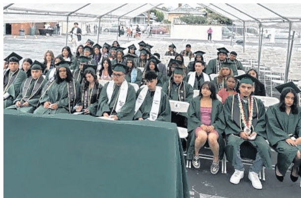
Los estudiantes cuentan con clases más personalizadas para asegurar de éxito escolar.